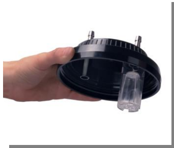
Conectores rápidos y válvula de seguridad. Connectors and safety valve.