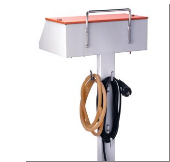
Asa de transporte, sujeta cables y tubos. Transport handle, cables and tubes hold up.

Aspirador para drenaje gástrico, de aspiración continuo/intermitente, con selector de vacío prefijado a 90/120 mmHg y mandos reguladores de los ciclos de paro y puesta en marcha. El aspirador modelo AI-78, dispone de un sistema de aspiración completamente silencioso y libre de engrases, siendo estos factores óptimos para la utilización en UVI, UCI y salas.