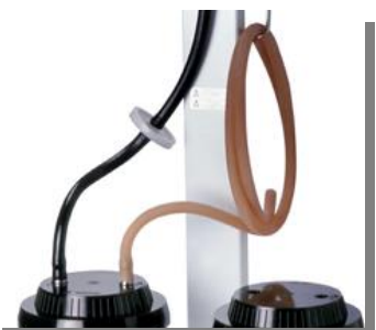
Filtro Bactericida. Bactericide filter

Variación de la presión con la altura respecto nivel del mar, a temperatura de 22°C . Vacuum variation in relation to altitude above sea level, at a temperature of 22°C.