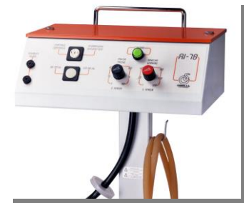
Panel de mandos con selector de continuos intermitentes. Control panel with continuous or intermittent selector.